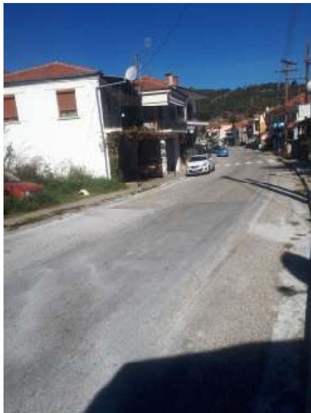
Κεντρικός δρόμος οικισμού