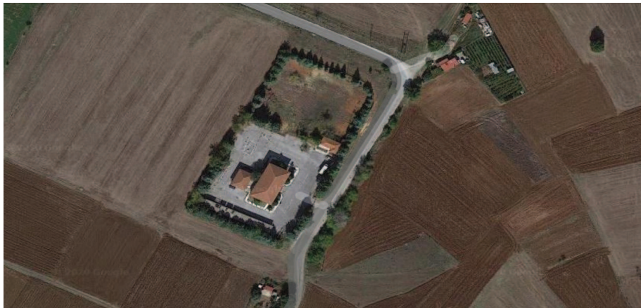
Εικόνα 1 Απεικόνιση οικοπέδου εγκατάστασης