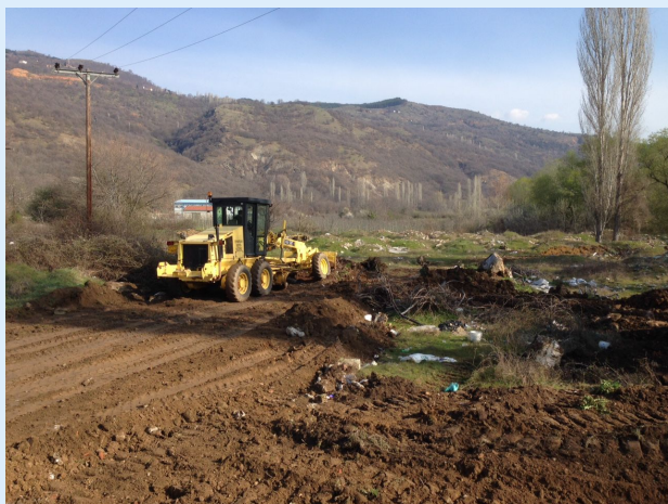
Παράλληλα Έργα Αναδάσμου