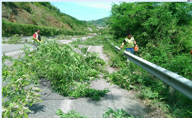
Κοπή χόρτων Ε.Ο. Δικτύου