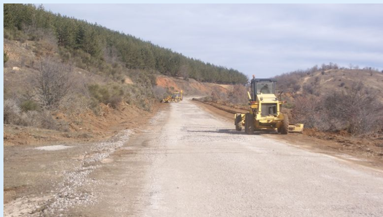
Καθαρισμός Τάφρων Οδικού Δικτύου