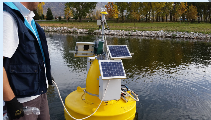
Πλωτός Σταθμός Εκβολές Ρεμάτων

Οι μετρήσεις του δικτύου συγκεντρώνονται τηλεμετρικά σε κεντρικό υπολογιστή, όπου επεξεργάζονται και αξιολογούνται για την εξαγωγή χρήσιμων συμπερασμάτων για την οικολογική κατάσταση της λίμνης ή τον εντοπισμό πηγών προέλευσης ρυπαντικών φορτίων. Πέρα από τη συλλογή μετρήσεων, το δίκτυο μας προειδοποιεί εγκαίρως για την εμφάνιση επικίνδυνων συμβάντων.