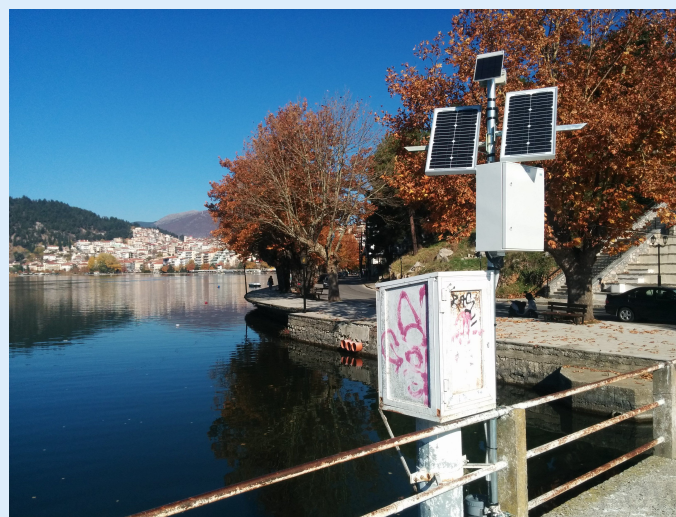
Σταθερός Σταθμός, θέση Σταυρός